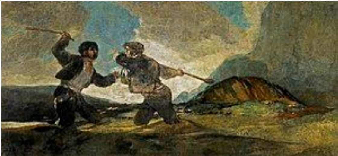
Fight with Cudgels, Francisco Goya, El Prado Madrid

vorm van groei vergroten we het probleem zonder dat we ons ervan bewust zijn. Dat is zeldzaam sprekend in beeld gebracht door Francisco Goya.